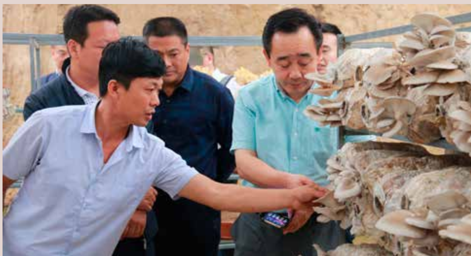
图为陕西延长县 菌草种植产业帮扶